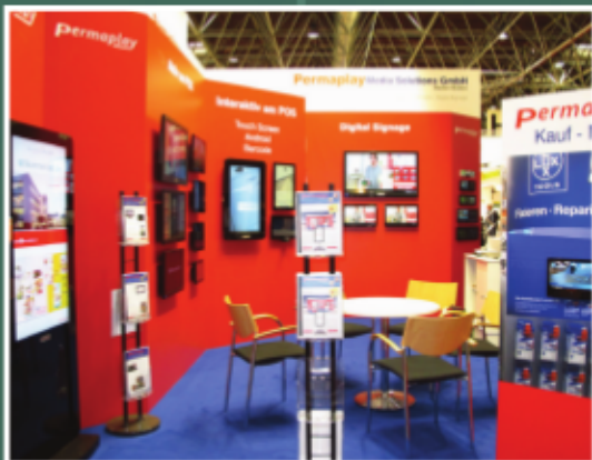
Auf der EuroShop gab es viele Beispiele zu sehen, wie sich die Medien in Shop-Systeme integrieren lassen ...